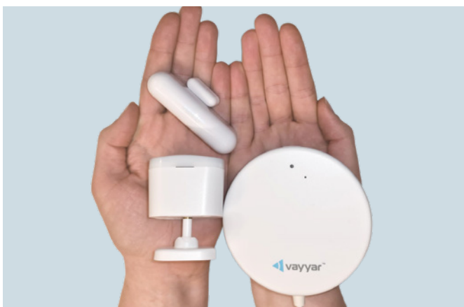
Die Sensoren sind klein und fügen sich unauffällig in die Wohnung ein.

Obendrein unterstützt es im Alltag durch viele Zusatzfunktionen, wie Medikamenten-, Termin- und Trinkerinnerung oder aktivierende Gespräche, Eingabe der Blutdruckwerte und Gewicht mit Verlauf. All das ohne komplizierte Bedienung – über die Sprachassistentin Vivi.