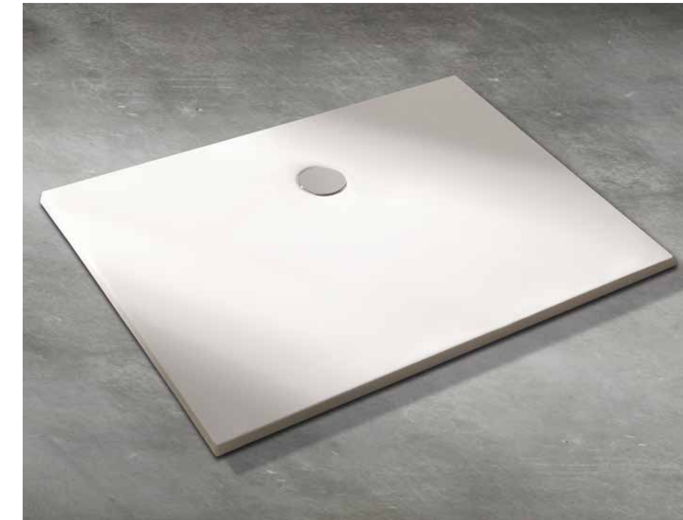
Koralle T400 – Mineralguss | 90 x 90 x 30 | 100 x 100 x 30 | 1200 x 800 x 30 | 1200 x 900 x 30 | 1400 x 900 x 30 mm