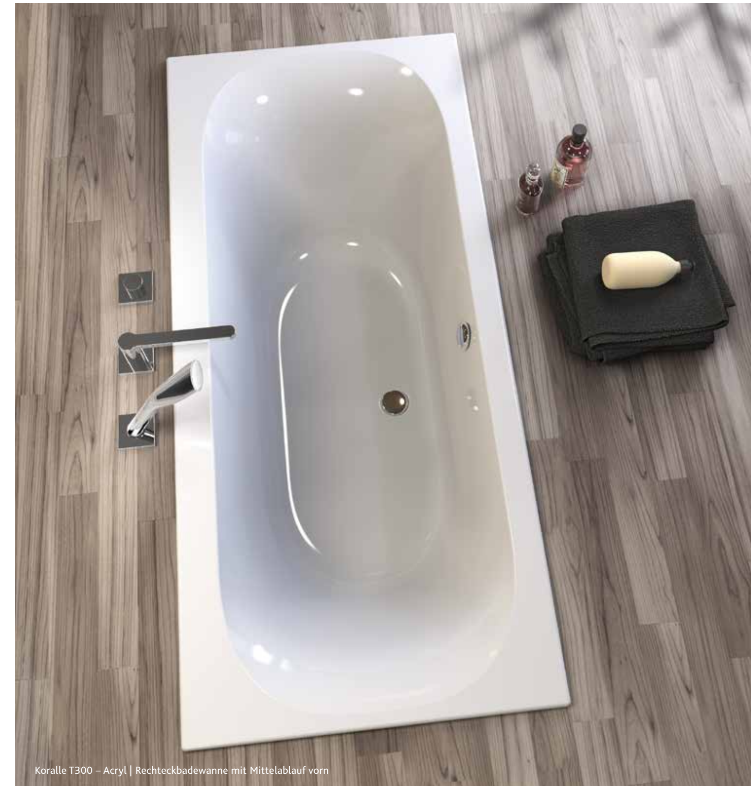
Koralle T300 – Acryl | Rechteckbadewanne mit Mittelablauf vorn