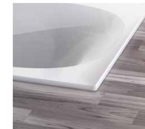
Extrem flacher Wannenrand

Acryl als Material ist bruchfest und pflegeleicht, bremst die Rutschgefahr und hat eine geringe elektrische Leitfähigkeit. Auf der glatten Oberfläche hat Schmutz keine Chance. Der Werkstoff ist durchgefärbt, so dass kleinere Schäden einfach wegpoliert werden können. Das geringe Eigengewicht ermöglicht die einfache Montage.