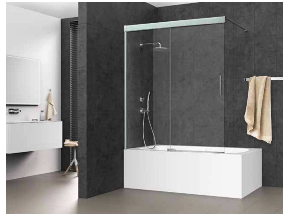
Koralle S600Plus Duschschiebetür auf Badewanne 2tlg. | Designblende Menta