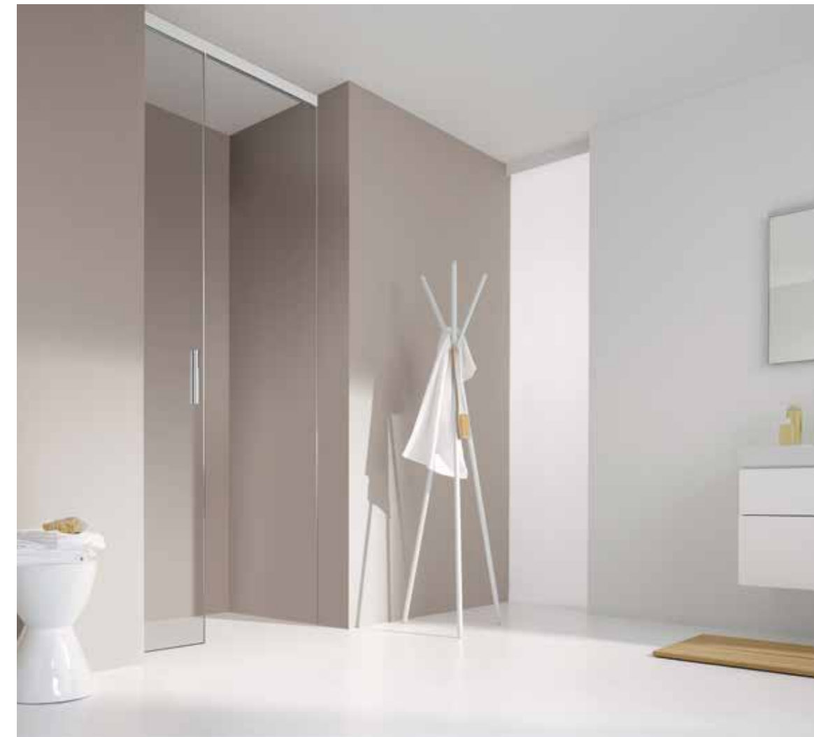
Koralle S606Plus Duschschiebetür hinter Vormauerung 1tlg. | Designblende Bianco

Die raumgebende und integrative Lösung in beliebiger Höhe ist modern und innovativ. Sie empfiehlt sich als platzsparende Abgrenzung von Duschräumen – z.B. hinter Vormauern mit Wärmespeichereffekt oder für mehr Komfort in WalkIn-Situationen. Wahlweise mit Spiegelglas. Ihre filigrane Befestigung erzielt auch als S600Plus Badewannenabtrennung eine wunderbar leichte Optik.